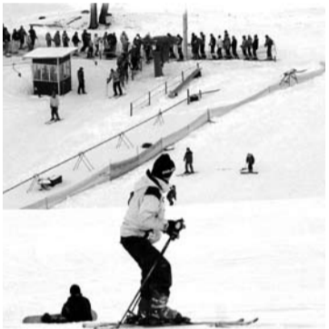
Slidininkai juokauja, kad šiemet slidinėjimo sezonas ant „Kalitos“ prasidės žiemai net nepasibaigus.

Pramogų ir sporto centras „Kalita“ pradėjo ruoštis slidinėjimo sezonui.