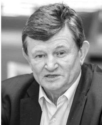
Sergejus JOVAIŠA, LR Seimo narys, konservatorius:

„Manu, kad reikia priimti, bet reikia tinkamo varianto, nes yra labai daug oponentų, kuriems nepatinka vienoks ar kitoks siūlymas. Mokesčio diskusija pavirto į tai, kad gali būti nepriimtas joks sprendimas – tam Seime tiesiog trūksta balsų.